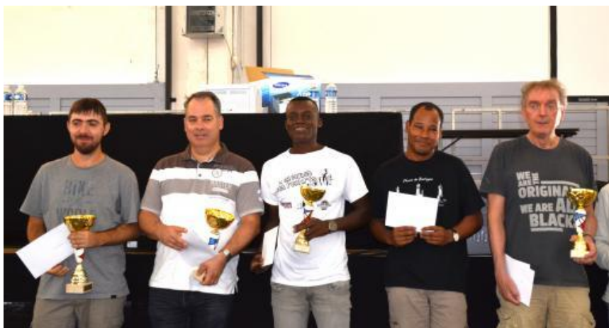
Les 5 premiers du classement général à La Rochelle