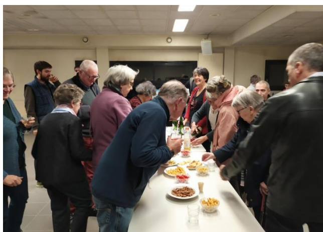
Un moment de convivialité toujours apprécié