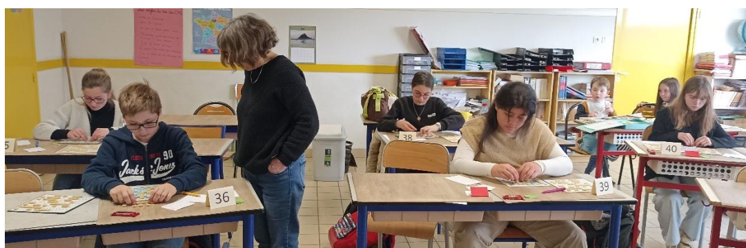
... puis c'est l'heure de la partie officielle. Ci-dessus, les collégiens