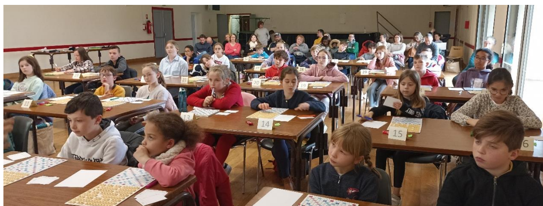
Phase d'initiation, tous les enfants sont attentifs