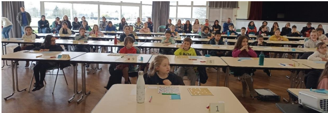
Enfants, enseignants et parents, tout le monde écoute avec attention les explications