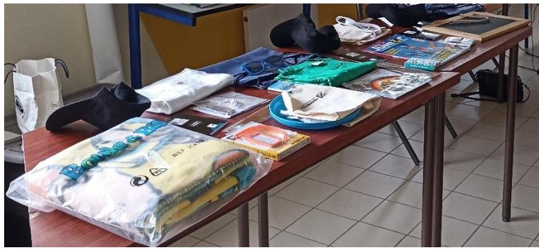
Après la partie et le goûter, une tombola qui fait toujours des heureux...