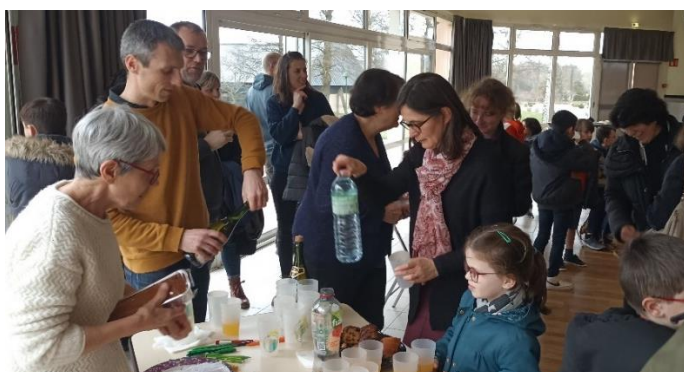
Le temps du goûter, un moment convivial...