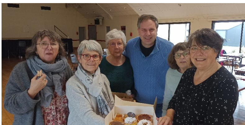
Pas d'anniversaire sans gâteau...