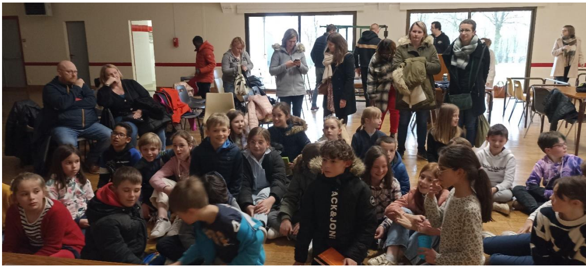
Tout le monde est à l'écoute des résultats