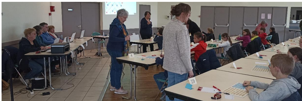
Puis c'est la partie officielle ; on essaie et réessaie avant d'inscrire sa solution sur le bulletin jeu, ici pour les primaires...