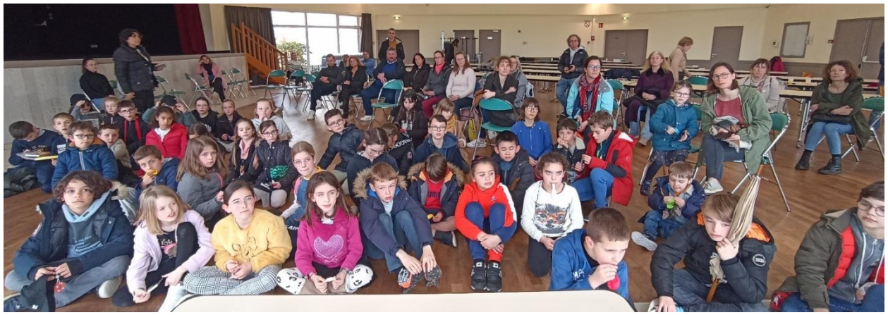
Une belle assistance pour le tirage de la tombola puis l'annonce des résultats