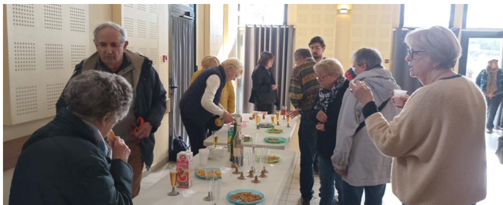
Avant de quitter Saint-Malo, partage d'un moment de convivialité