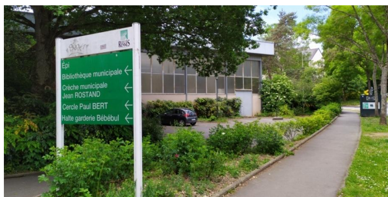
Parking rue Tanguy Malmanche