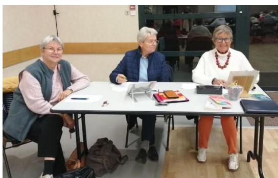
Trois Malouines au ramassage des bulletins...