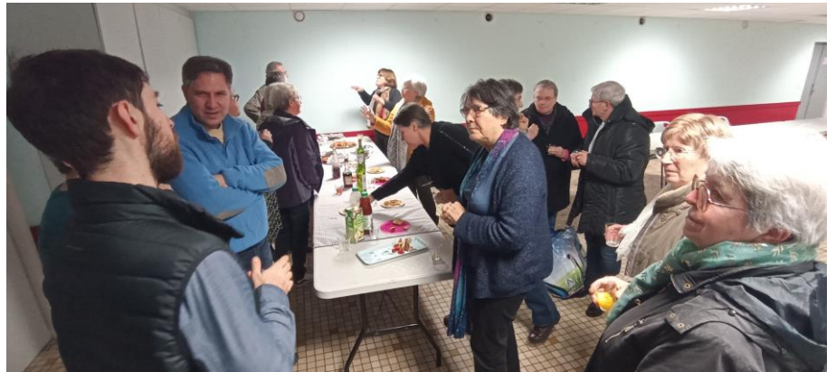
Avant de quitter les Samaritains et Samaritaines, derniers échanges autour d'une table bien garnie