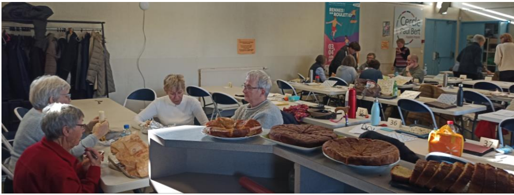
A la pause du midi, c'est l'heure du réconfort avec les pâtisseries maison...