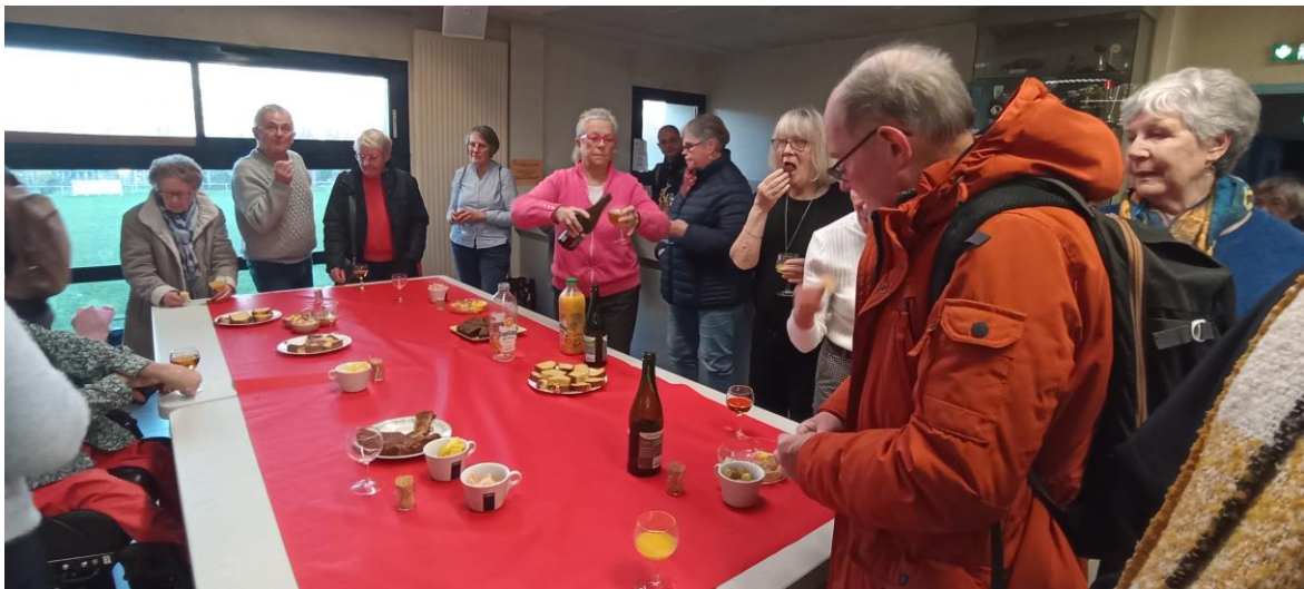
Pour terminer en beauté la journée, rien de mieux qu'un moment de convivialité gourmand