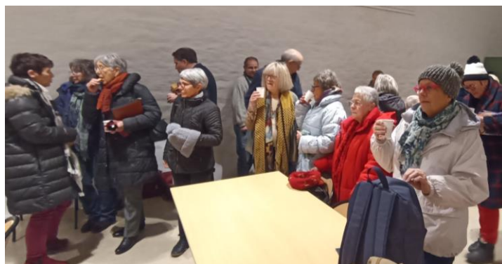
Partage d'un moment de convivialité, on change d'année mais pas d'habitudes !