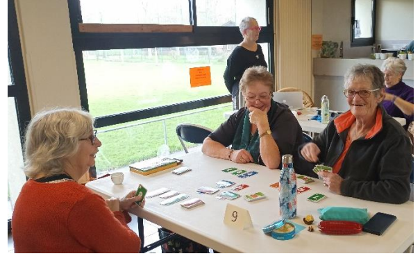
... suivie de détente avec Jarnac ou cartes

La 1 ère partie, rapide avec seulement 16 coups et donc terminée tôt, permet de commencer la 2 ème partie à 13h30.