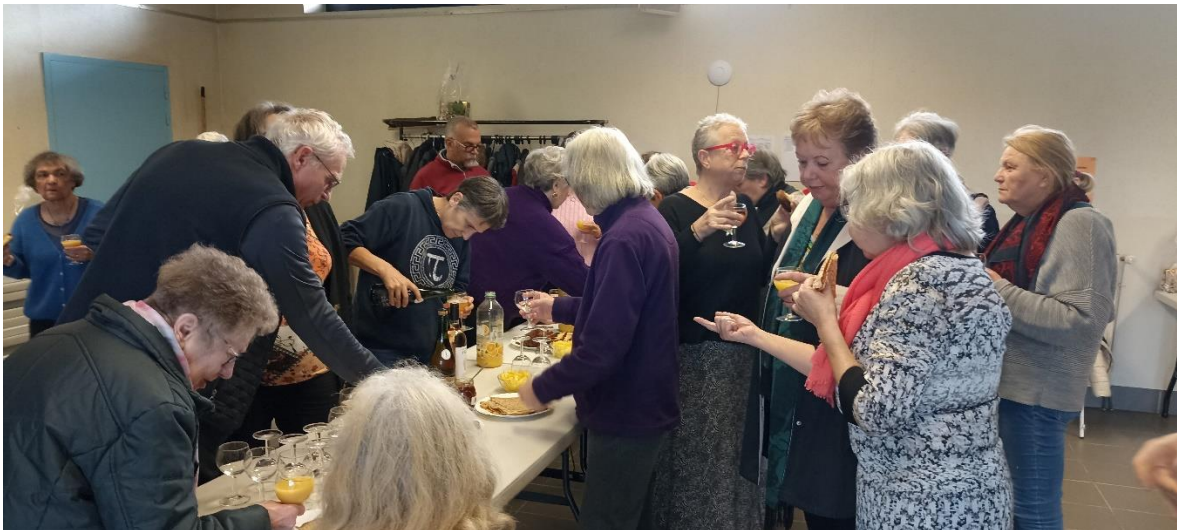
Le tournoi se termine par un gourmand moment de convivialité