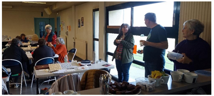
La pause déjeuner, assis ou debout...