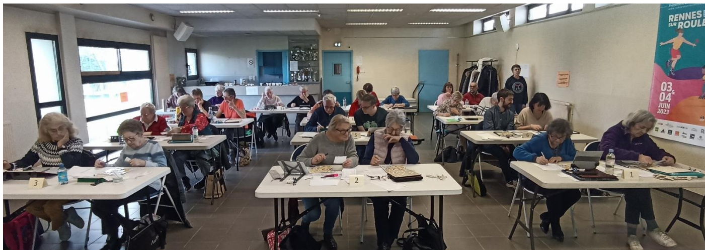
Des duos prêts pour une compétition où méthodologie et complémentarité sont de bons atouts pour réussir

Treize duos venus de Saint-Malo, Sainte-Marie et Rennes se retrouvent dans la salle du CPB Rapatel Poterie pour cette 4 ème édition du championnat brétilien en paires qui comporte deux parties, l'une en matinée et l'autre l'après-midi, une organisation qui permet à tous, et surtout aux plus éloignés de Rennes, de rentrer assez tôt.