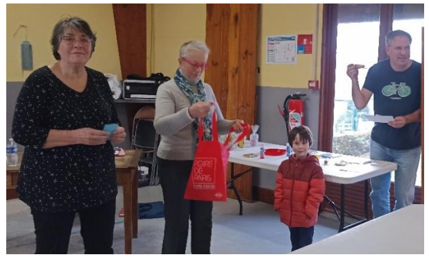
avant le tirage de la tombola