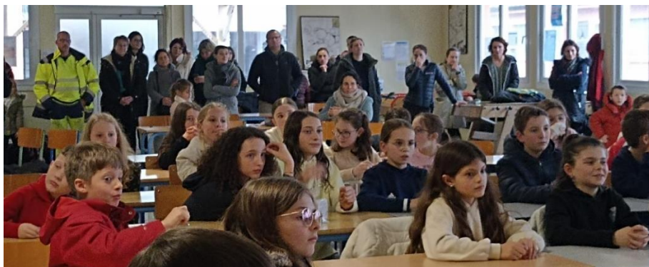
A l'écoute des résultats

Les enfants terminant aux trois premières places de leur niveau sont récompensés :