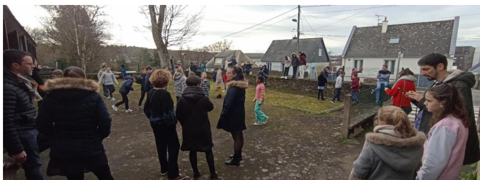
Moment de défilé apprécié