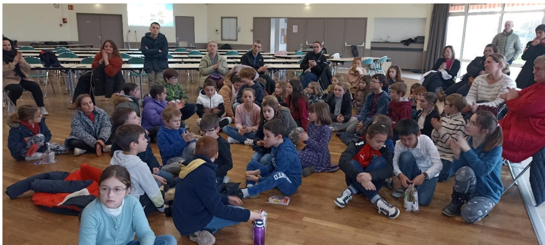
Regroupement pour le tirage de la tombola puis l'annonce des résultats