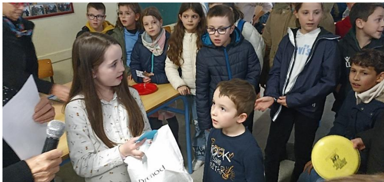
Goûter pour petits et grands... puis tirage de la tombola