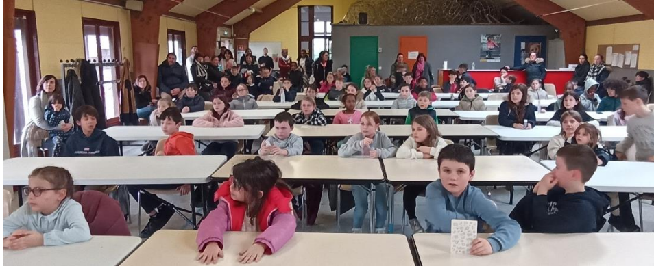
Tous à l'écoute des résultats

Les enfants terminant aux trois premières places de leur niveau sont récompensés :