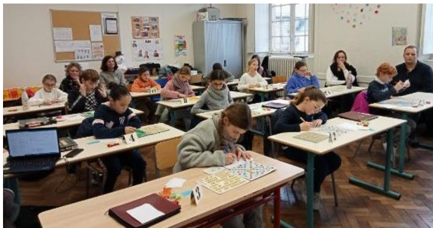
Des enfants appliqués pour la partie officielle

Les enfants terminant aux deux premières places de leur niveau sont récompensés :