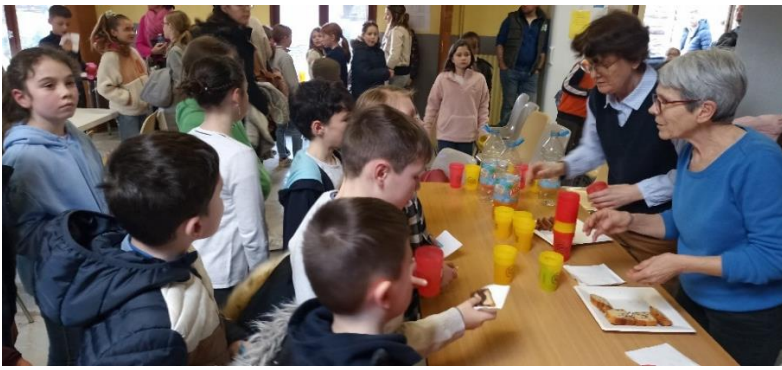
Goûter pour tout le monde...