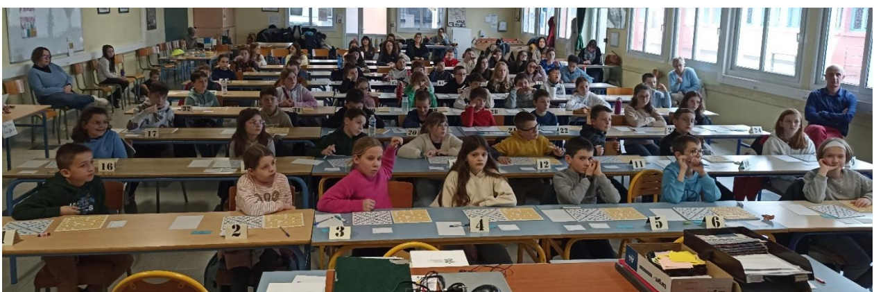
Des enfants prêts à jongler avec les caramels pour trouver la meilleure solution