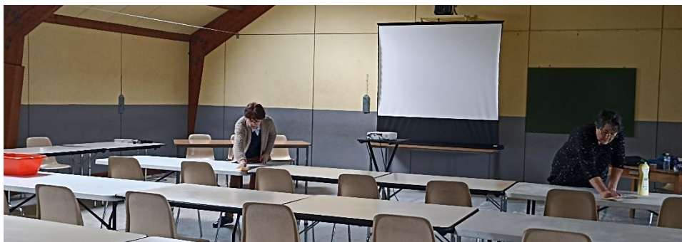
Le scrabble mène à tout...