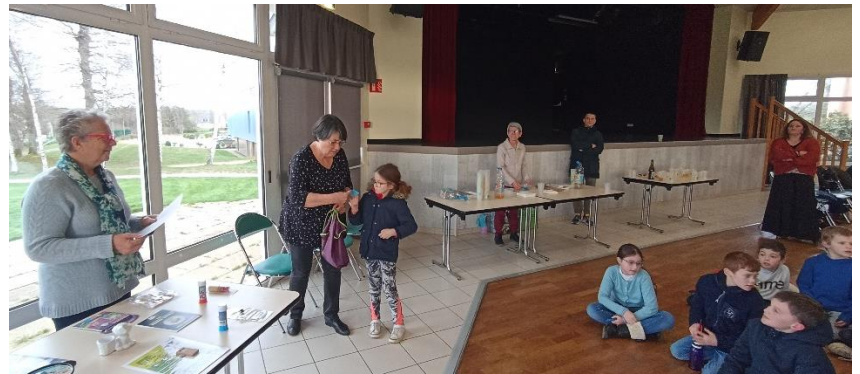
Goûter pour petits et grands... et tirage de la tombola