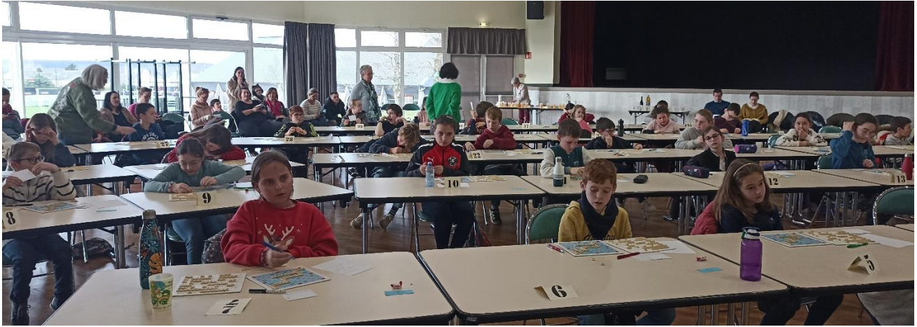
Puis c'est la partie officielle ; on essaie et réessaie avant d'inscrire sa solution sur le bulletin jeu