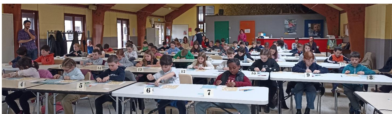
Concentration et réflexion avant d'inscrire sa solution sur le bulletin jeu