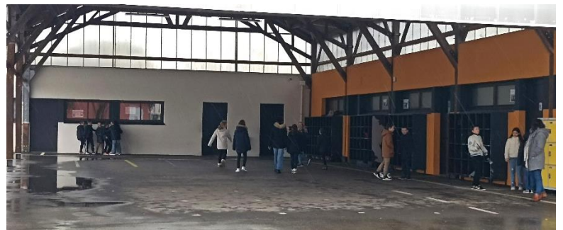
Moment de défilé apprécié, à l'abri de la pluie !