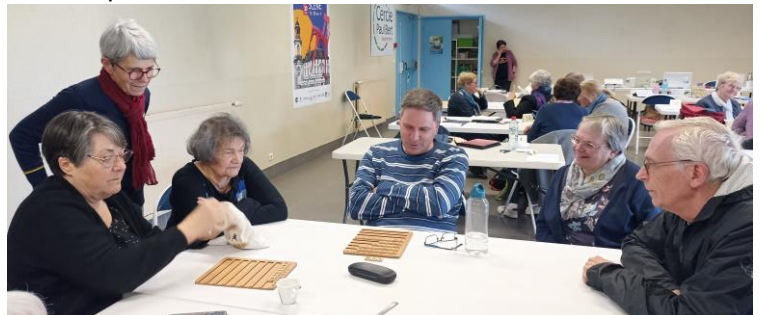
Une partie de Jarnac en attendant la reprise