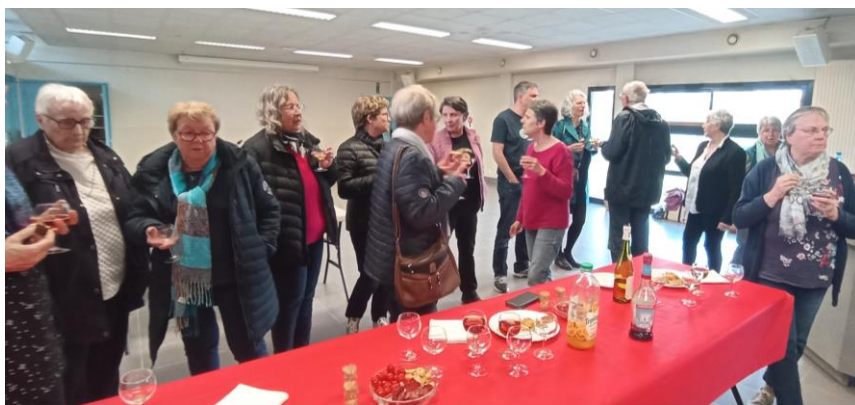
Fin de journée en partageant un moment de convivialité