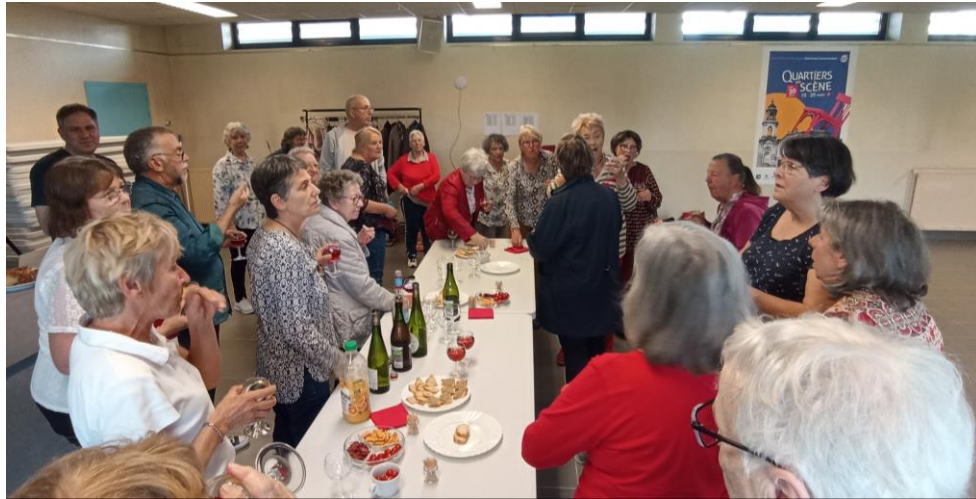
Annnonce des résultats et partage d'un moment de convivialité