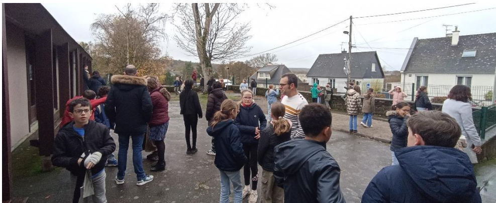
Moment de dévouement apprécié malgré quelques gouttes de pluie

les différentes cases de la grille, la valeur des lettres, le bulletin jeu et la manière de le remplir ( référencement alphanumérique, comptage des points ). Elle répond aux nombreuses questions des enfants.