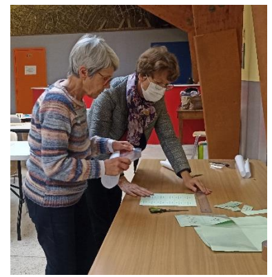
Préparation des tickets « goûter »