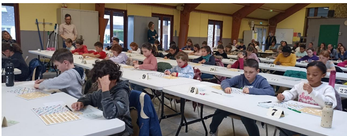
Concentration et réflexion pour trouver le meilleur possible avec les lettres du tirage