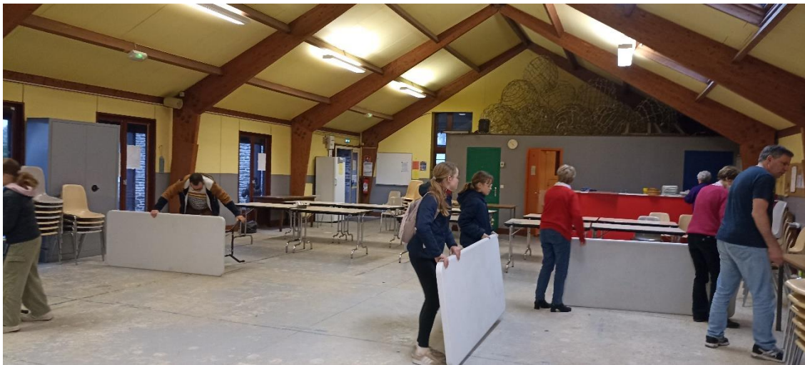
Dernière mission de la journée, le rangement avec l'aide d'enfants et d'enseignants

La liste des enfants qualifiés pour la finale régionale sera communiquée dès que la dernière finale bretonne et les finales morbihannaise et finistérienne auront eu lieu.