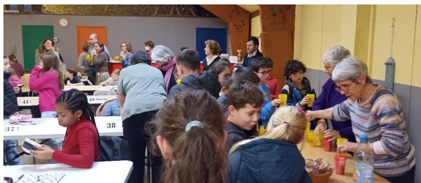
Goûter pour petits et grands...

Au terme de la partie, place à la détente avec le goûter et une tombola qui permet à une vingtaine d'enfants de repartir avec un petit lot. Puis c'est l'annonce des résultats.