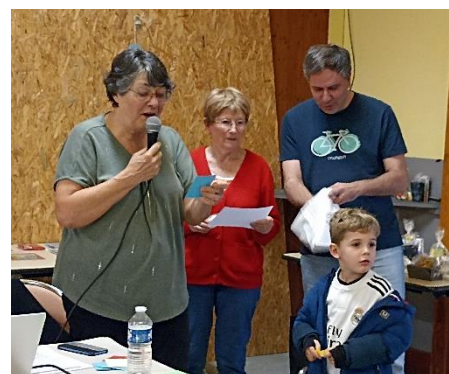
et tirage de la tombola

Les enfants terminant aux trois premières places de leur niveau sont récompensés :