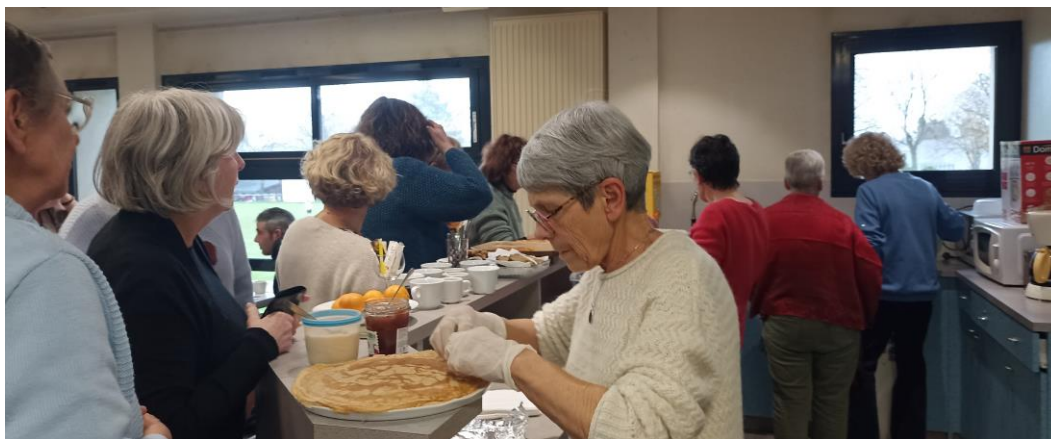
Pause gourmande autour de boissons chaudes, gâteaux maison et crêpes