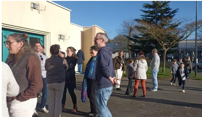
Moment de détente apprécié, avec un soleil plutôt rare en cette deuxième quinzaine de janvier !