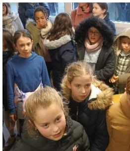
Des enfants intéressés par la tombola