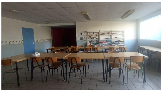
La salle à notre arrivée...

La salle est un peu juste pour recevoir tout le monde mais après beaucoup de réflexion et d'essais, nous trouvons la solution, bien aidés par Sophie pour récupérer des tables ci et là ... mais il ne fallait pas un enfant de plus !