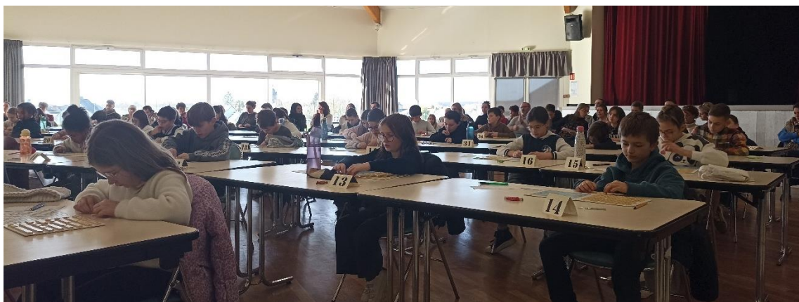
Des enfants concentrés pour trouver la meilleure solution