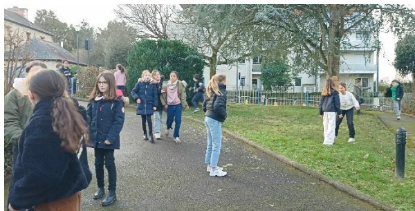
Un temps clément pour une pause à l'extérieur