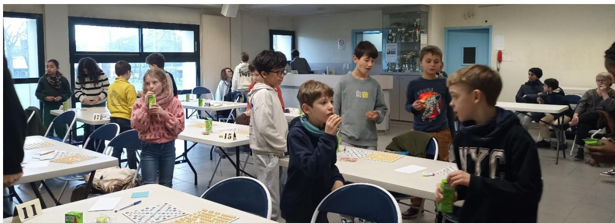
Pause goûter avant d'attaquer la partie officielle