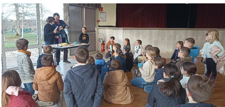
puis tirage de la tombola