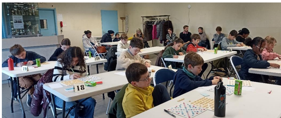
La partie officielle, un moment toujours pris très au sérieux par les enfants