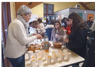
Goûter pour petits et grands