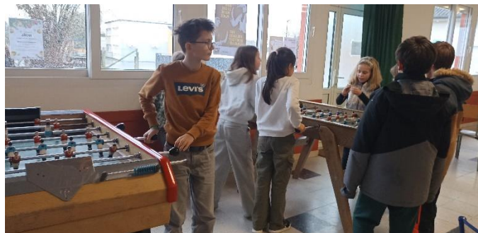
Pause détente avant la partie officielle