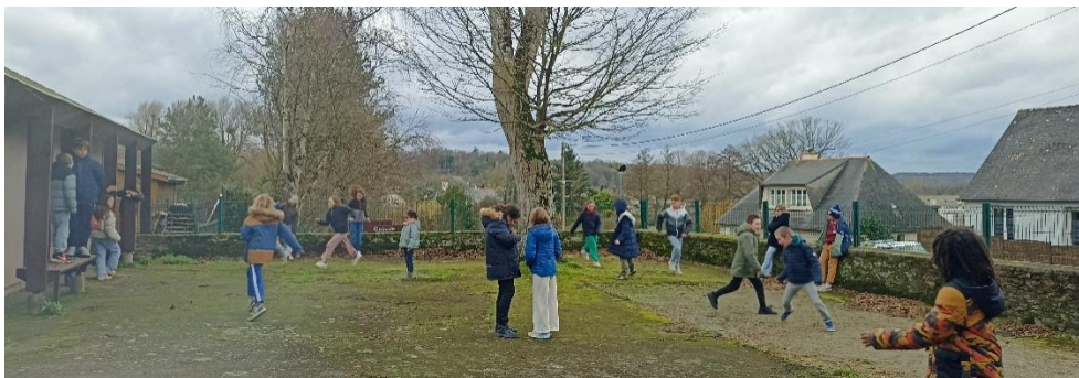
Ciel gris mais sans pluie, ça suffit pour un moment de détente indispensable entre phase d'initiation et partie officielle