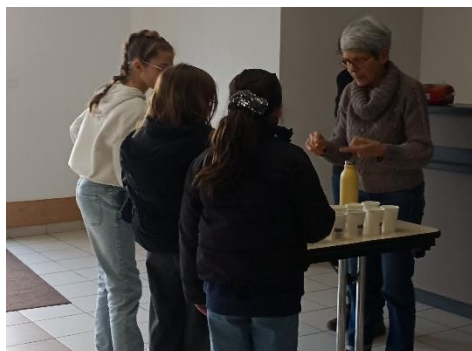
Goûter pour tous...