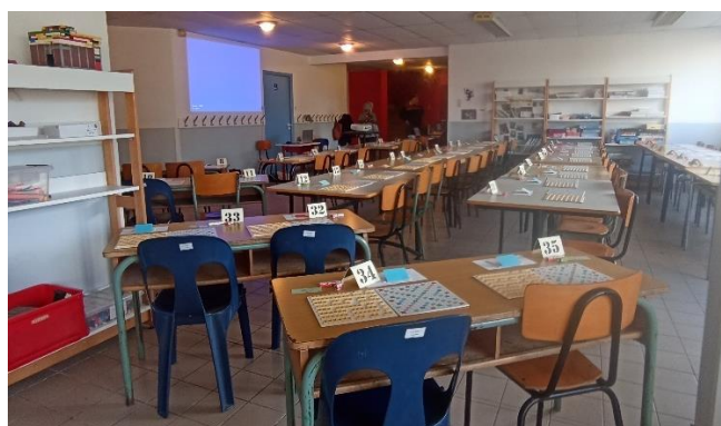
puis avec 43 tables plus l'arbitrage