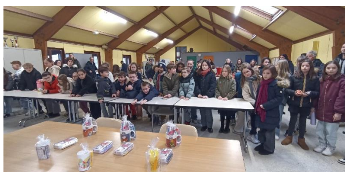
et annonce des résultats