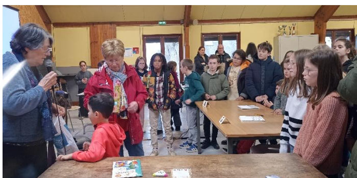
Puis tirage de la tombola...