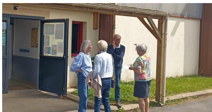
Pause de l'après-midi, gourmandise et soleil au menu